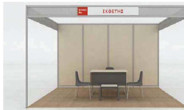
Stand 3 όψεων