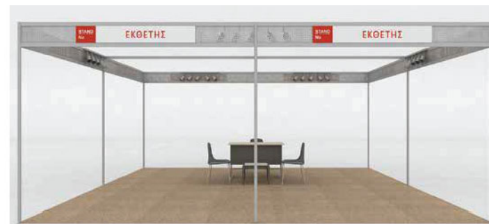
Stand 4 όψεων

Στο τιμολόγιο ενοικίου εκθετηρίου χώρου με εξοπλισμό (Τύπος 2) από τη ΔΕΘ - HELEXPO, περιλαμβάνεται η κατασκευή περιπτερού σύμφωνα με τις παραπάνω προδιαγραφές